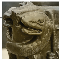
الشعبان من كأس غوديا